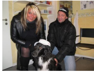
Dixie hat eine Mütze gewonnen