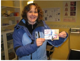
Man freut sich über Tierarzt- Witze