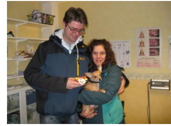
Die gewonnenen Leckerlis werden gerecht geteilt