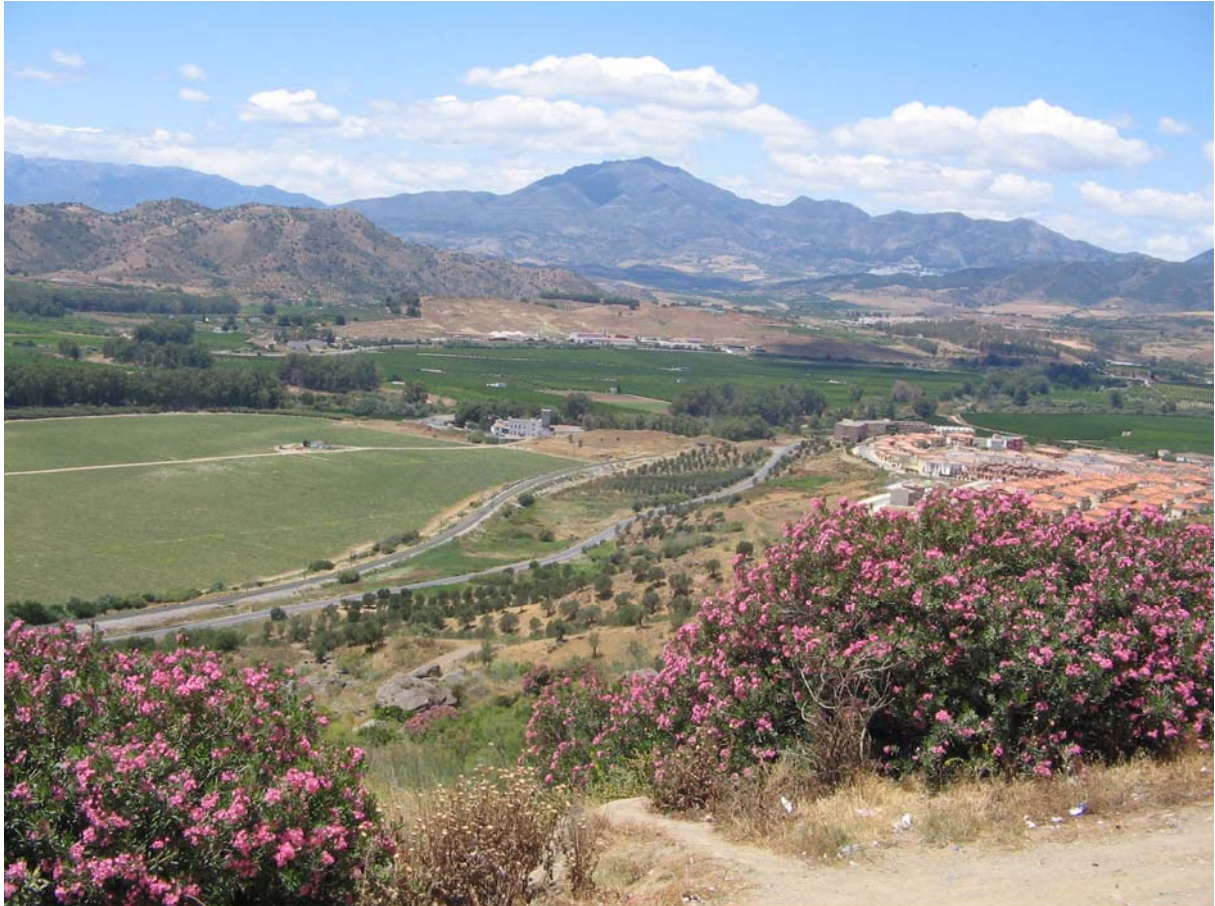
(Ausblick über Pizarra)